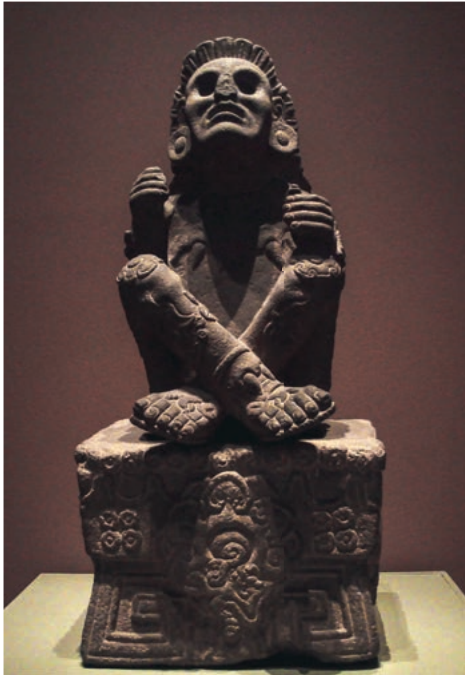
Reproducción del dios Xochipilli, deidad por excelencia de Tlalmanalco. Escultura encontrada en 1920. Actualmente forma parte del Museo Nacional de Antropología e Historia.